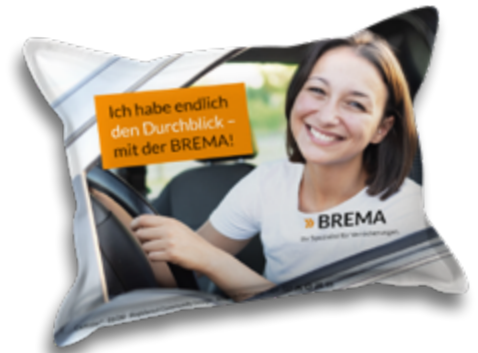
Ansicht des fertigen CarKoser®

• Wir empfehlen diese Angabe aufgrund der Textilkennzeichnungsverordnung.