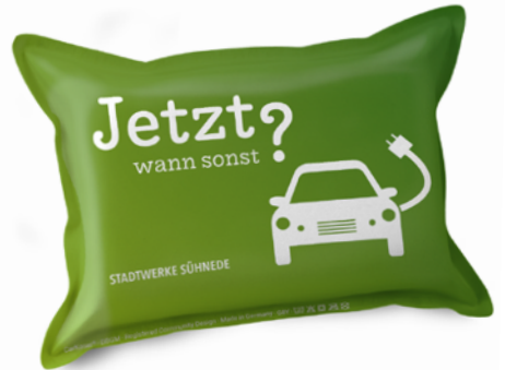
Ansicht des fertigen CarKoser®

• Wir empfehlen diese Angabe aufgrund der Textilkennzeichnungsverordnung.