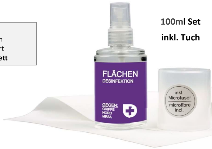
100ml Set inkl. Tuch

Druck Etikett in 4C Photoqualität Flasche: 47x120mm Tuch: 20x20cm - 100g Microfaser (Evolon)