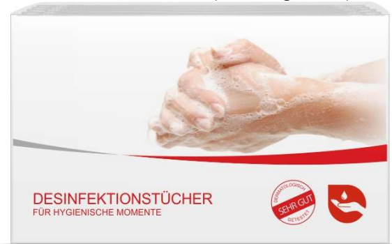
Box - Frontansicht (mit Einlegerkarte)